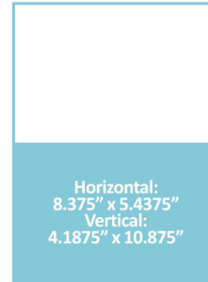
½ Página Horizontal o Vertical