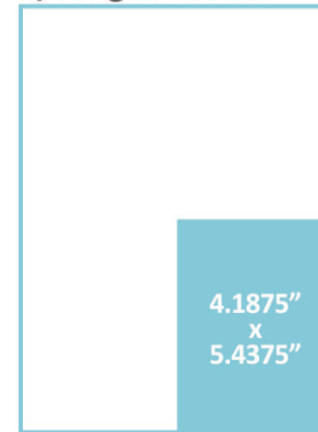
1/4 Página Vertical