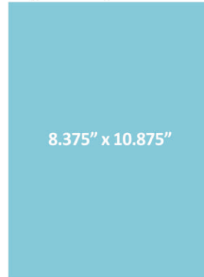
Contraportada o Página Simple